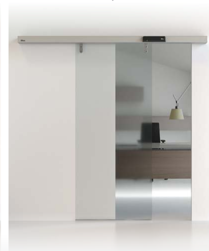
PORTA SCORREVOLE CIVIK E DAS