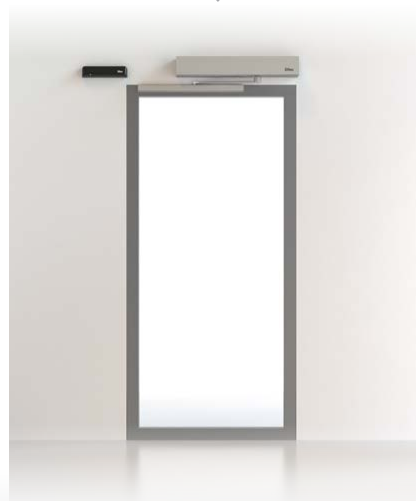
PORTA A BATTENTE DAB E SPRINT